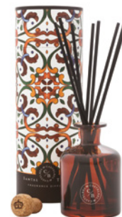
Difusor de Fragrância Fragrance Diffuser 250 mL / 8.5 fl.oz Ref: 1-9101