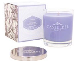
Vela Aromática Aromatic Candle 210 g / 7.4 oz Ref: 1-0701