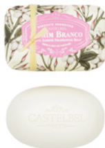
Sabonete Aromático Aromatic Soap 150 g / 5.3 oz Ref: 1-1505