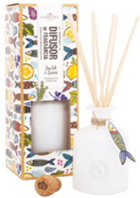
Difusor de Fragrância Fragrance Diffuser 250 mL / 8.5 fl.oz Ref: 1-0076