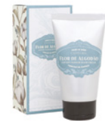
Creme de Mãos Hand Cream 60 mL / 2 fl.oz Ref: 1-2226