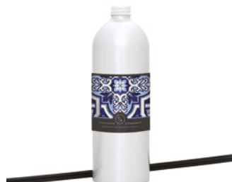
Recarga para Difusor Diffuser Refill 900 mL / 30.4 fl.oz Ref: 1-9146