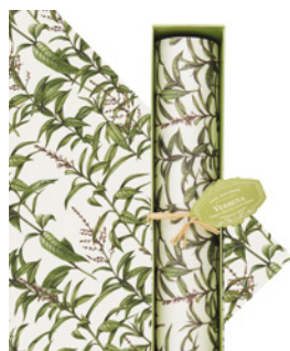
Papel Perfumado para Gavetas Drawer Lining Paper 6 Folhas / 6 Sheets Ref: 1-1902