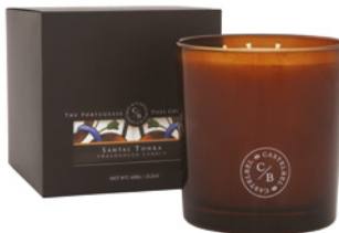
Vela Aromática Três Pavios Three Wick Aromatic Candle 600 g / 21.2 oz Ref: 1-9154