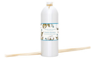
Recarga para Difusor Diffuser Refill 900 mL / 30.4 fl.oz Ref: 1-2233