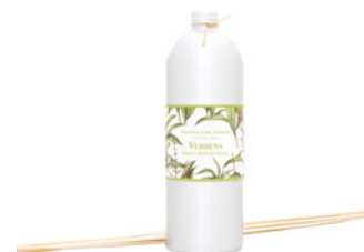
Recarga para Difusor Diffuser Refill 900 mL / 30.4 fl.oz Ref: 1-1933