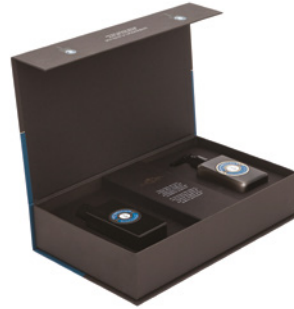
Coffret Sal Marinho e Toranja Sea Salt & Grapefruit Gift Set Ref: 9-0692