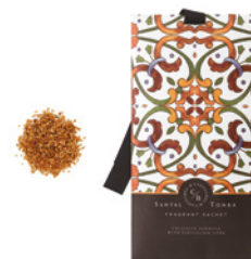
Saqueta Perfumada Fragrant Sachet 10 g / 0.35 oz Ref: 1-9103