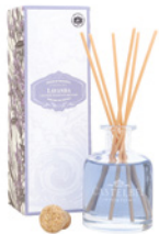
Difusor de Fragrância Fragrance Diffuser 100 mL / 3.4 fl.oz Ref: 1-0725