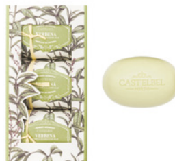
Caixa de Sabonetes Aromáticos Aromatic Soap Set 3 x 150 g / 5.3 oz Ref: 1-1906