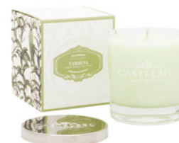
Vela Aromática Aromatic Candle 210 g / 7.4 oz Ref: 1-1901