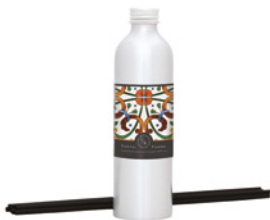
Recarga para Difusor Diffuser Refill 250 mL / 8.5 fl.oz Ref: 1-9147