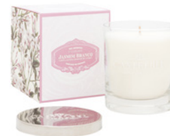
Vela Aromática Aromatic Candle 210 g / 7.4 oz Ref: 1-1501