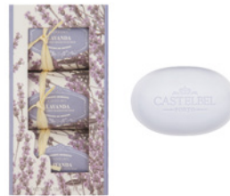
Caixa de Sabonetes Aromáticos Aromatic Soap Set 3 x 150 g / 5.3 oz Ref: 1-0706