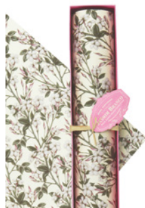
Papel Perfumado para Gavetas Drawer Lining Paper 6 Folhas / 6 Sheets Ref: 1-1502