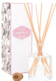
Difusor de Fragrância Fragrance Diffuser 250 mL / 8.5 fl.oz Ref: 1-1504