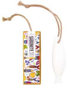
Sabonete Aromático Lemon & Sea Salt Aromatic Soap 80 g / 2.8 oz Ref: 1-0030