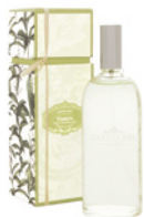
Spray de Perfume para Casa Room Fragrance 100 mL / 3.4 fl.oz Ref: 1-1903