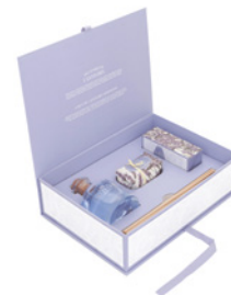
Coffret - Difusor, Sabonete e Creme de Mãos Gift Set - Diffuser, Soap & Hand Cream Ref: 1-0735