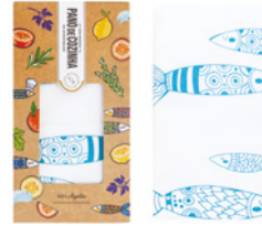
Pano de Cozinha Boxed Kitchen Cloth Ref: 1-9194