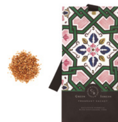
Saqueta Perfumada Fragrant Sachet 10 g / 0.35 oz Ref: 1-9135