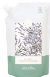
Recarga Gel para Mãos e Corpo Hand & Body Wash Refill Pouch 500 mL / 16.9 fl.oz Ref: 1-0728