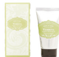
Creme de Mãos Hand Cream 60 mL / 2 fl.oz Ref: 1-1926