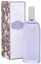
Spray de Perfume para Casa Room Fragrance 100 mL / 3.4 fl.oz Ref: 1-0703