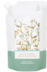
Recarga Gel para Mãos e Corpo Hand & Body Wash Refill Pouch 500 mL / 16.9 fl.oz Ref: 1-2228