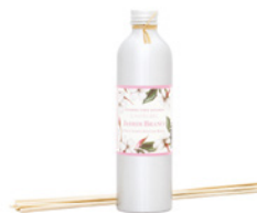
Recarga para Difusor Diffuser Refill 250 mL / 8.5 fl.oz Ref: 1-1532