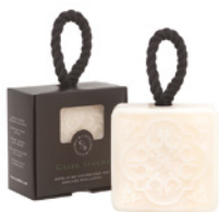
Esfoliante Sólido Perfumado Exfoliating Scented Body Bar 150 g / 5.3 oz Ref: 1-9192