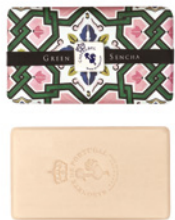
Sabonete Aromático Aromatic Soap 200 g / 7 oz Ref: 1-9134