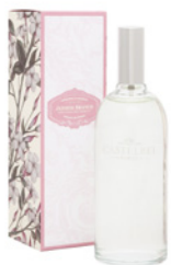
Spray de Perfume para Casa Room Fragrance 100 mL / 3.4 fl.oz Ref: 1-1503