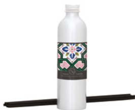
Recarga para Difusor Diffuser Refill 250 mL / 8.5 fl.oz Ref: 1-9149