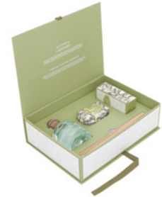
Coffret - Difusor, Sabonete e Creme de Mãos Gift Set - Diffuser, Soap & Hand Cream Ref: 1-1935