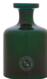
Garrafa de Vidro Verde Green Glass Bottle 2 L / 67.6 fl.oz Ref: 1-9144