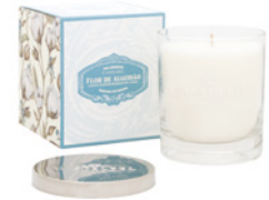
Vela Aromática Aromatic Candle 210 g / 7.4 oz Ref: 1-2201