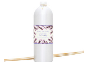
Recarga para Difusor Diffuser Refill 900 mL / 30.4 fl.oz Ref: 1-0733