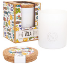
Vela Aromática Aromatic Candle 190 g / 6.7 oz Ref: 1-0074