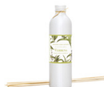
Recarga para Difusor Diffuser Refill 250 mL / 8.5 fl.oz Ref: 1-1932