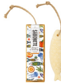
Sabonete Aromático Orange & Rosemary Aromatic Soap 80 g / 2.8 oz Ref: 1-9131