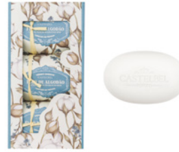
Caixa de Sabonetes Aromáticos Aromatic Soap Set 3 x 150 g / 5.3 oz Ref: 1-2206