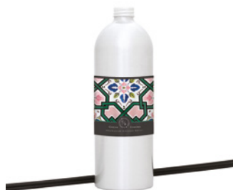
Recarga para Difusor Diffuser Refill 900 mL / 30.4 fl.oz Ref: 1-9150