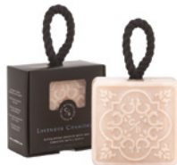
Esfoliente Sólido Perfumado Exfoliating Scented Body Bar 150 g / 5.3 oz Ref: 1-9196