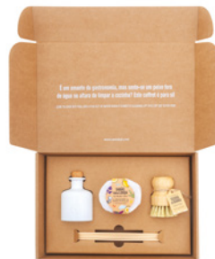
Coffret Essenciais de Cozinha Giftset Kitchen Essentials Ref: 1-9226