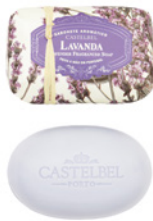
Sabonete Aromático Aromatic Soap 150 g / 5.3 oz Ref: 1-0705