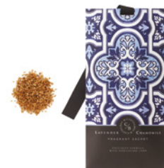
Saqueta Perfumada Fragrant Sachet 10 g / 0.35 oz Ref: 1-9099