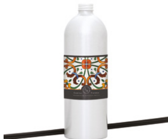
Recarga para Difusor Diffuser Refill 900 mL / 30.4 fl.oz Ref: 1-9148