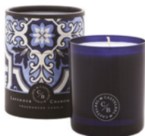
Vela Aromática Aromatic Candle 210 g / 7.4 oz Ref: 1-9096