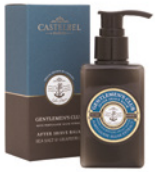
Bálsamo After Shave After Shave Balm 100 mL / 3.4 fl.oz Ref: 9-0691