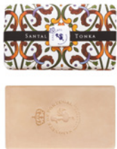
Sabonete Aromático Aromatic Soap 200 g / 7 oz Ref: 1-9102