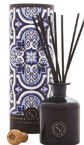
Difusor de Fragrância Fragrance Diffuser 250 mL / 8.5 fl.oz Ref: 1-9097