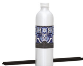
Recarga para Difusor Diffuser Refill 250 mL / 8.5 fl.oz Ref: 1-9145