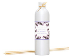
Recarga para Difusor Diffuser Refill 250 mL / 8.5 fl.oz Ref: 1-0732