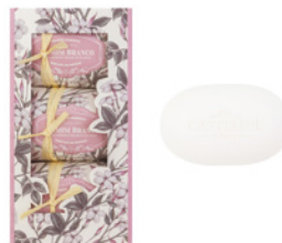
Caixa de Sabonetes Aromáticos Aromatic Soap Set 3 x 150 g / 5.3 oz Ref: 1-1506