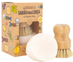
Sabão para Louça e Escova de Bambu Dish Washing Soap with bamboo brush 150 g / 5.3 oz Ref: 1-9193