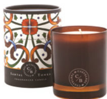
Vela Aromática Aromatic Candle 210 g / 7.4 oz Ref: 1-9100