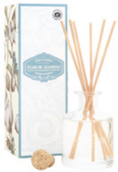
Difusor de Fragrância Fragrance Diffuser 100 mL / 3.4 fl.oz Ref: 1-2225