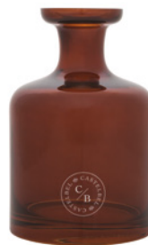
Garrafa de Vidro Âmbar Amber Glass Bottle 2 L / 67.6 fl.oz Ref: 1-9143