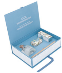
Coffret - Difusor, Sabonete e Creme de Mãos Gift Set - Diffuser, Soap & Hand Cream Ref: 1-2235