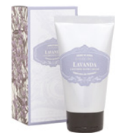
Creme de Mãos Hand Cream 60 mL / 2 fl.oz Ref: 1-0726