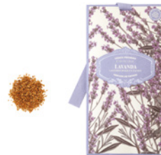
Saqueta Perfumada Fragrant Sachet 10 g / 0.35 oz Ref: 1-0710