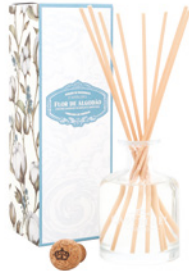
Difusor de Fragrância Fragrance Diffuser 250 mL / 8.5 fl.oz Ref: 1-2204