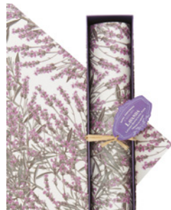
Papel Perfumado para Gavetas Drawer Lining Paper 6 Folhas / 6 Sheets Ref: 1-0702