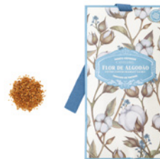
Saqueta Perfumada Fragrant Sachet 10 g / 0.35 oz Ref: 1-2210