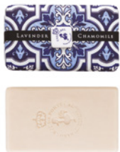
Sabonete Aromático Aromatic Soap 200 g / 7 oz Ref: 1-9098