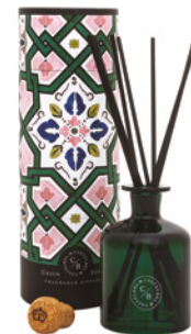
Difusor de Fragrância Fragrance Diffuser 250 mL / 8.5 fl.oz Ref: 1-9133