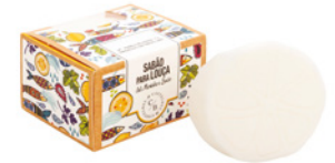
Sabão para Louça Dish Washing Soap 150 g / 5.3 oz Ref: 1-9151