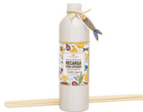
Recarga para Difusor Diffuser Refill 250 mL / 8.5 fl.oz Ref: 1-9081