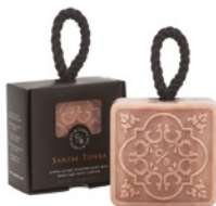
Esfoliante Sólido Perfumado Exfoliating Scented Body Bar 150 g / 5.3 oz Ref: 1-9195