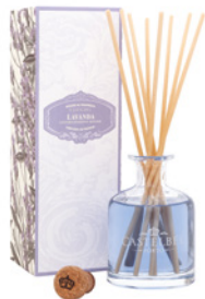
Difusor de Fragrância Fragrance Diffuser 250 mL / 8.5 fl.oz Ref: 1-0704