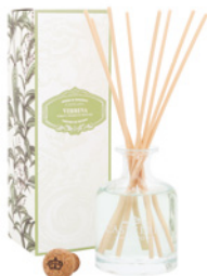
Difusor de Fragrância Fragrance Diffuser 250 mL / 8.5 fl.oz Ref: 1-1904