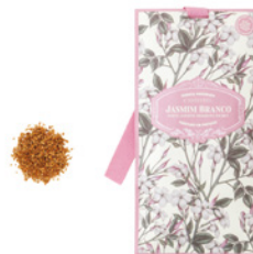
Saqueta Perfumada Fragrant Sachet 10 g / 0.35 oz Ref: 1-1510