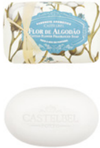
Sabonete Aromático Aromatic Soap 150 g / 5.3 oz Ref: 1-2205