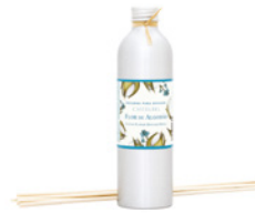
Recarga para Difusor Diffuser Refill 250 mL / 8.5 fl.oz Ref: 1-2232