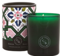
Vela Aromática Aromatic Candle 210 g / 7.4 oz Ref: 1-9132