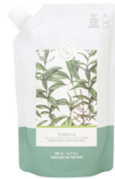
Recarga Gel para Mãos e Corpo Hand & Body Wash Refill Pouch 500 mL / 16.9 fl.oz Ref: 1-1928