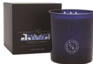
Vela Aromática Três Pavios Three Wick Aromatic Candle 600 g / 21.2 oz Ref: 1-9153