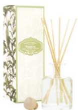
Difusor de Fragrância Fragrance Diffuser 100 mL / 3.4 fl.oz Ref: 1-1925