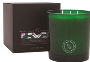
Vela Aromática Três Pavios Three Wick Aromatic Candle 600 g / 21.2 oz Ref: 1-9155