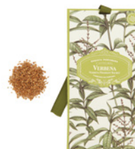
Saqueta Perfumada Fragrant Sachet 10 g / 0.35 oz Ref: 1-1910