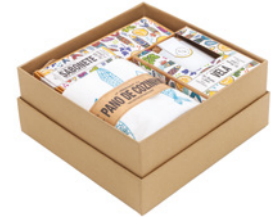
Coffret Sabonete, Vela e Pano de Cozinha Gift Set - Soap, Candle & Kitchen Cloth Ref: 1-9063