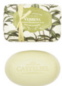
Sabonete Aromático Aromatic Soap 150 g / 5.3 oz Ref: 1-1905