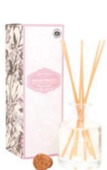
Difusor de Fragrância Fragrance Diffuser 100 mL / 3.4 fl.oz Ref: 1-1525