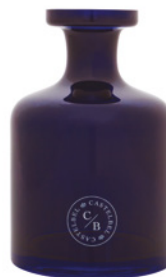
Garrafa de Vidro Azul Blue Glass Bottle 2 L / 67.6 fl.oz Ref: 1-9142