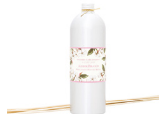
Recarga para Difusor Diffuser Refill 900 mL / 30.4 fl.oz Ref: 1-1533