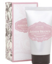
Creme de Mãos Hand Cream 60 mL / 2 fl.oz Ref: 1-1526