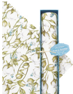
Papel Perfumado para Gavetas Drawer Lining Paper 6 Folhas / 6 Sheets Ref: 1-2202